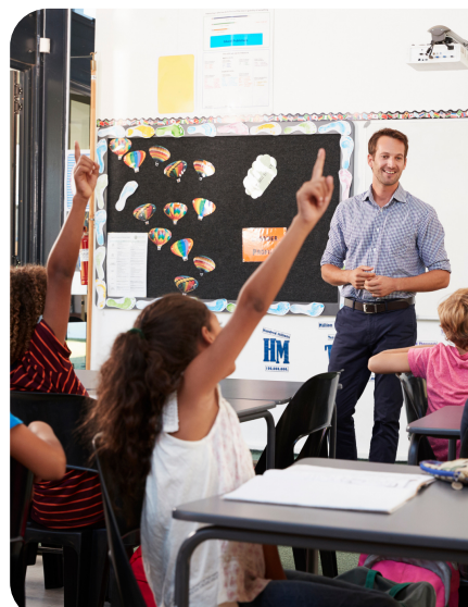
ШКОЛЫ И УЧРЕЖДЕНИЯ ОБУЧАЮЩИЕ ЗАВЕДЕНИЯ