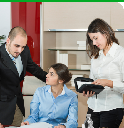
КАБИНЕТЫ И ОФИСЫ