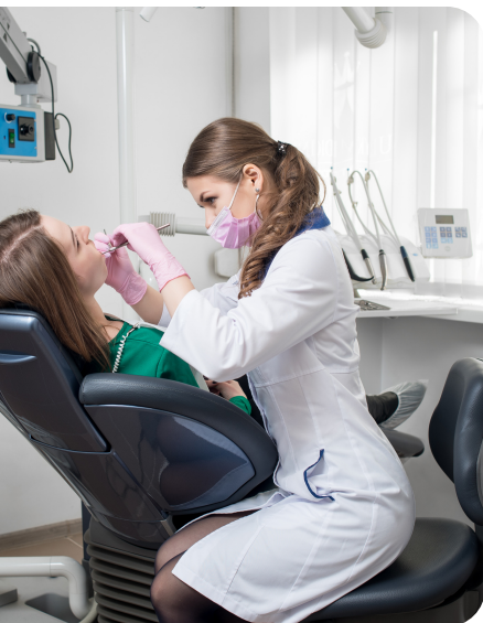
ЛЕЧЕБНЫЕ И ПРОФИЛАКТИЧЕСКИЕ УЧРЕЖДЕНИЯ