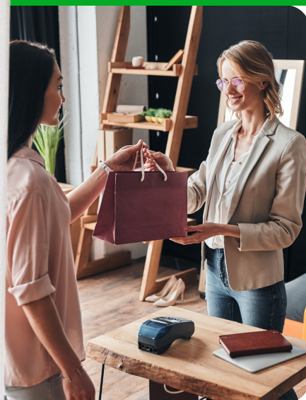
МАГАЗИНЫ И БУТИКИ