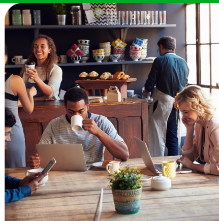
КАФЕ, КОФЕЙНИ БАРЫ И РЕСТОРАНЫ