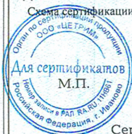
Схема сертификации: Ic